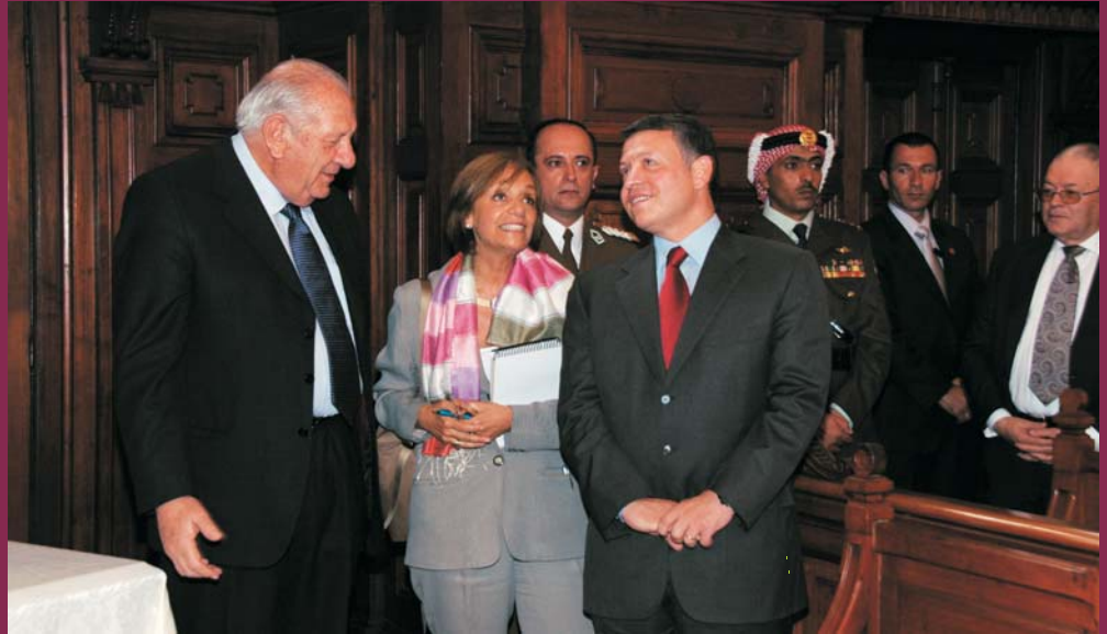
El rey junto al presidente de la Corte en el Salón de Honor.

Tras el intercambio de regalos, el presidente invitó al rey Abdullah a recorrer las dependencias del salón de pleno y la cúpula central, donde el rey se mostró muy interesado en la arquitectura y objetos simbólicos presentes en el edificio.