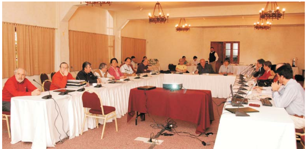
Los ministros en plena actividad en sus jornadas.

En materia de atención a usuarios, se resolvió crear oficinas de informaciones en diversos tribunales y una unidad especial de Atención de Asuntos de la Familia en los juzgados de