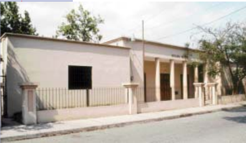
JUZGADO DE PAZ DEL MUNICIPIO DE BONAÓ