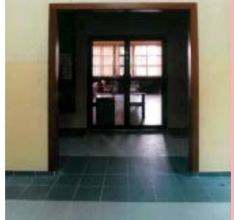
CÁMARA CIVIL Y COMERCIAL DE LA PRIMERA CIRCUNSCRIPCIÓN DEL JUZGADO DE PRIMERA INSTANCIA DEL CN