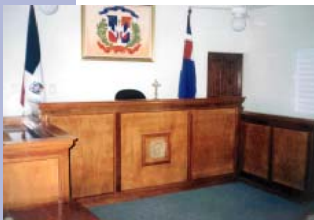
Suprema Corte de