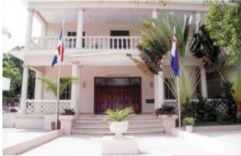
CORTE DE TRABAJO DE SANTO DOMINGO