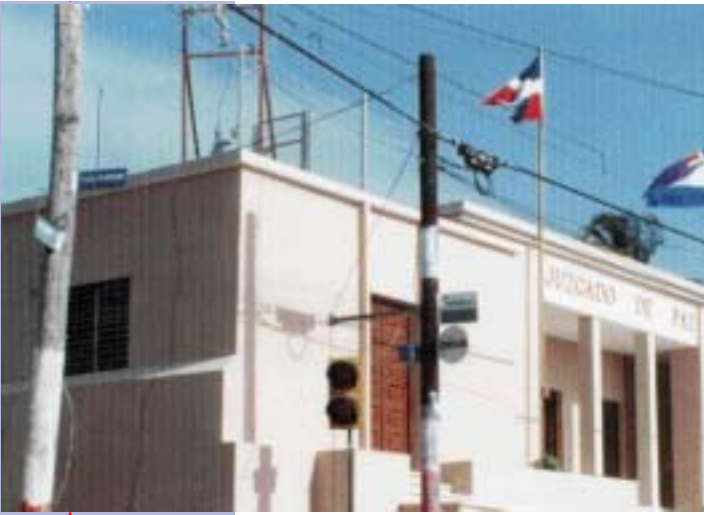
JUZGADO DE PAZ DEL MUNICIPIO DE PARAÍSO