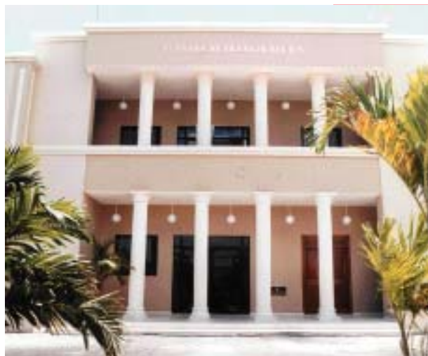
JUZGADO DE TRABAJO DEL DISTRITO