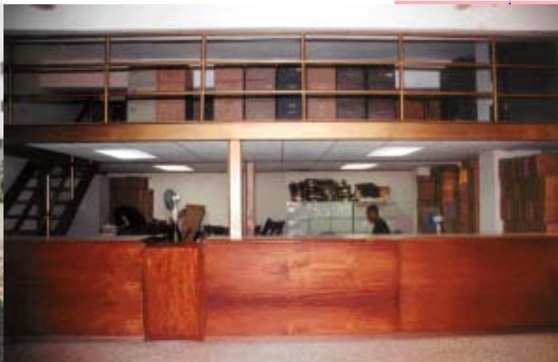
ÁREA DE SERVIOS DEL REGISTRO DE TÍTULOS DE SAN CRISTÓBAL