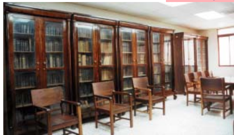
BIBLIOTECA DE LA CÁMARA PENAL DE LA CORTE DE APELACIÓN DEL DEPARTAMENTO JUDICIAL DE