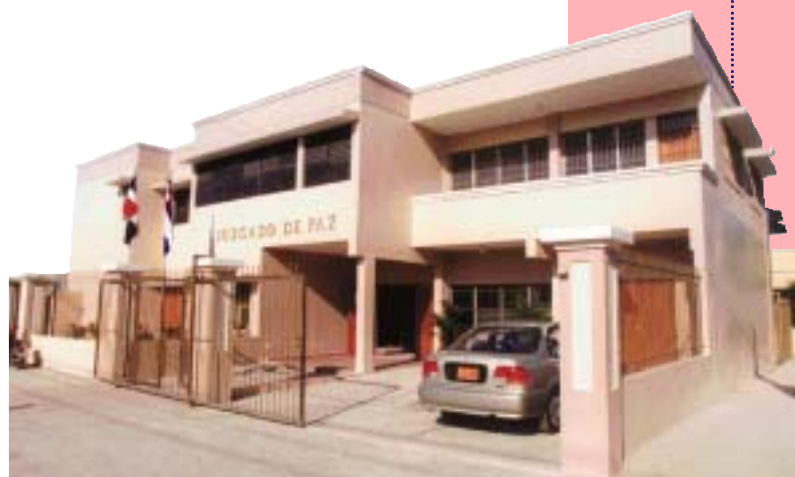
JUZGADO DE PAZ DE LA SÉPTIMA CIRCUNSCRIPCIÓN DEL DISTRITO NACIONAL