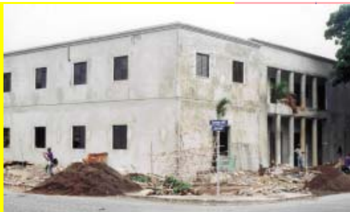
JUZGADO DE PAZ DE LA SEGUNDA CIRCUNSCRIPCIÓN DEL MUNICIPIO DE LA VEGA