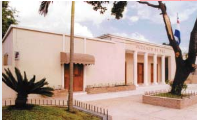
JUZGADO DE PAZ DE LA TERCERA CIRCUNSCRIPCIÓN DEL DISTRITO NACIONAL