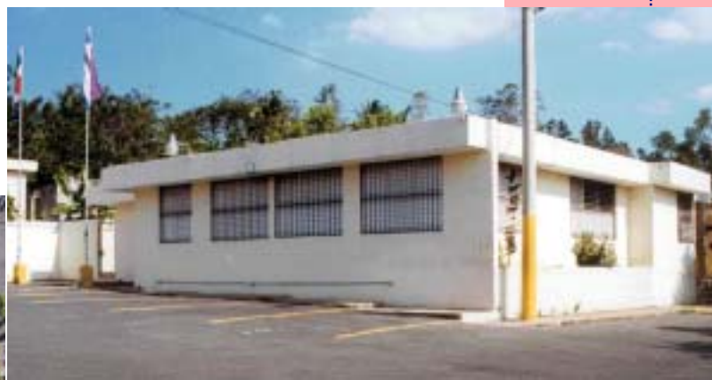
Huellas de la Reforma