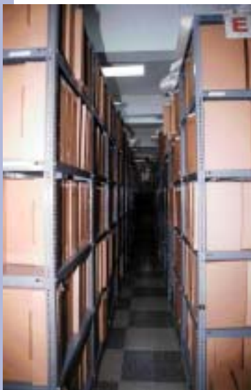
ARCHIVOS DEL TRIBUNAL SUPERIOR DE TIERRAS