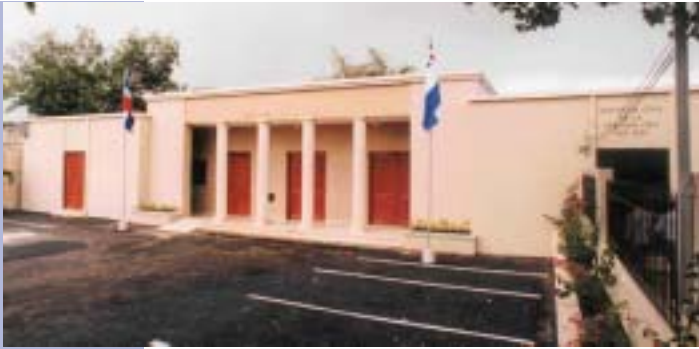
TRIBUNAL DE NIÑOS, NIÑAS Y ADOLESCENTES DEL DISTRITO