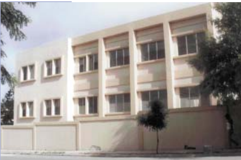
PALACIO DE JUSTICIA DE