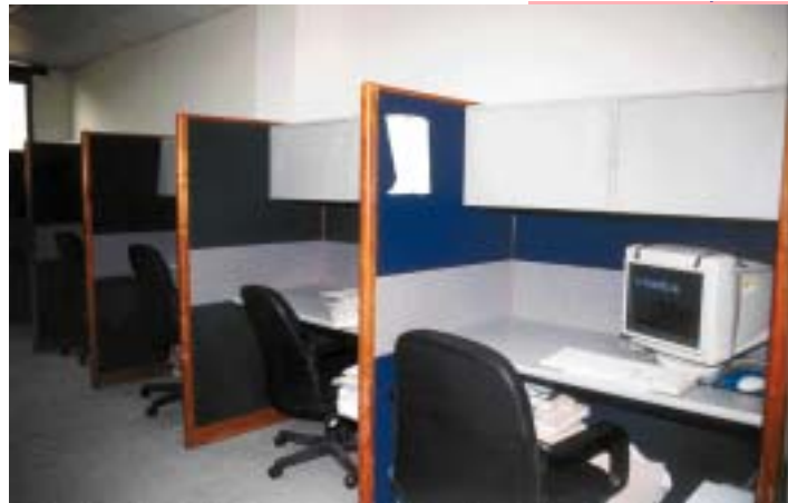
ÁREA PARA ABOGADOS AYUDANTES DEL TRIBUNAL SUPERIOR DE TIERRAS