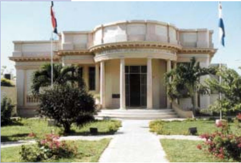
CORTE Y TRIBUNAL DE NIÑOS, NIÑAS Y ADOLESCENTES