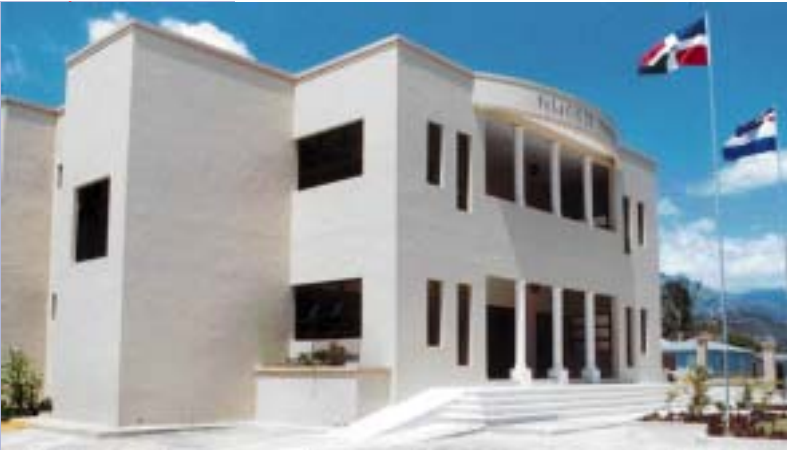
PALACIO DE JUSTICIA DE SAN JOSÉ DE