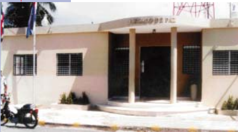
Suprema Corte de