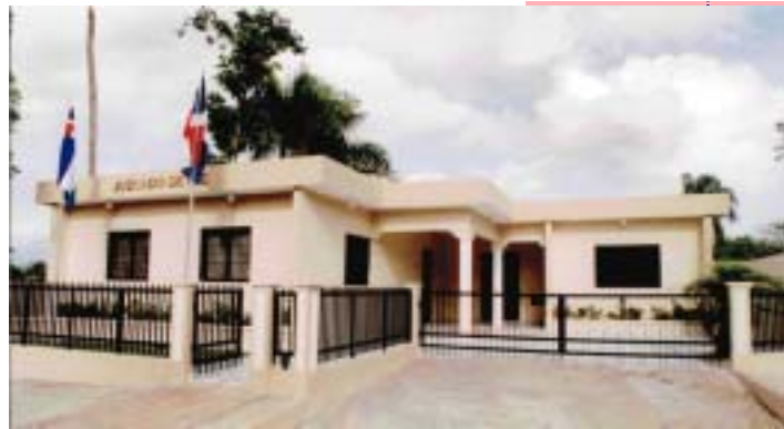
JUZGADO DE PAZ DEL MUNICIPIO DE