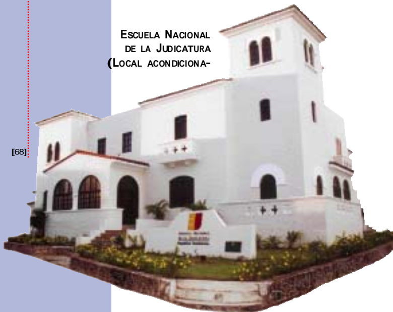
ESCUELA NACIONAL DE LA JUDICATURA (LOCAL ACONDICIONA-