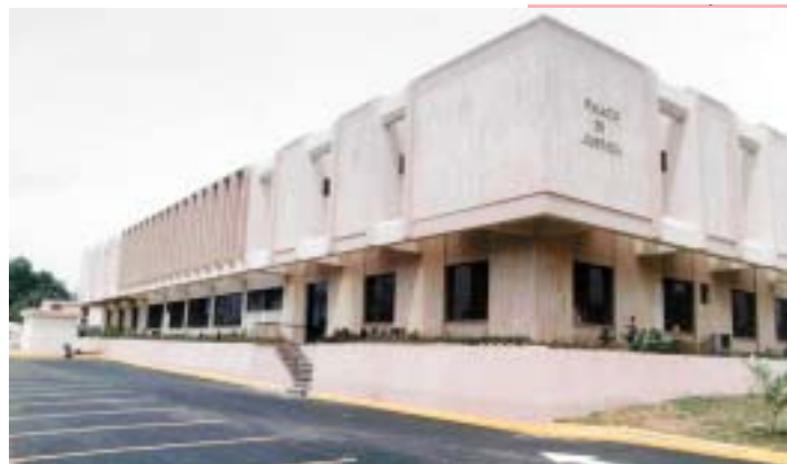
PALACIO DE JUSTICIA DE SAN FRANCISCO DE