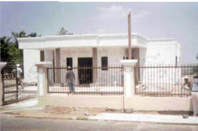
JUZGADO DE PAZ DEL MUNICIPIO DE VILLA FUNDACIÓN