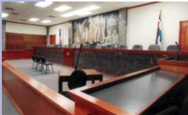
Suprema Corte de