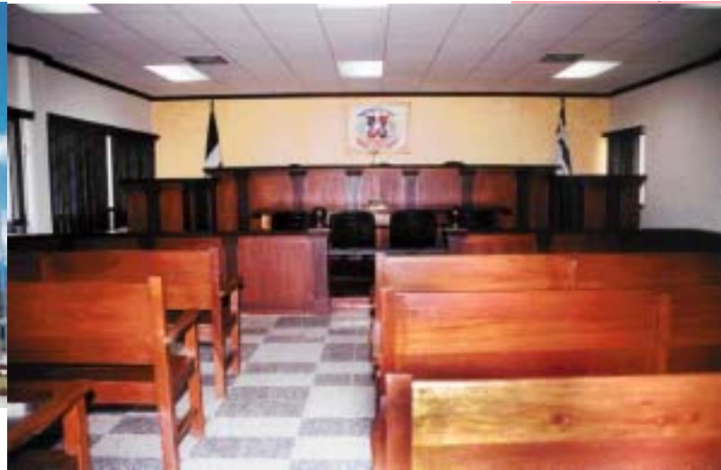
SALA DE AUDIENCIAS DEL TRIBUNAL SUPERIOR DE TIERRAS