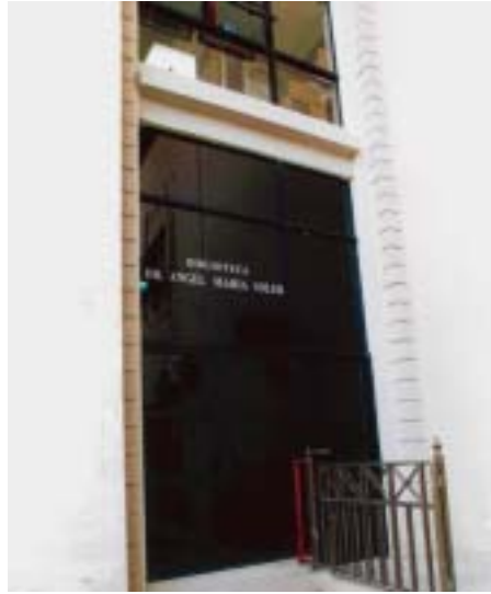
BIBLIOTECA DE LA SUPREMA CORTE DE JUSTICIA "DR.