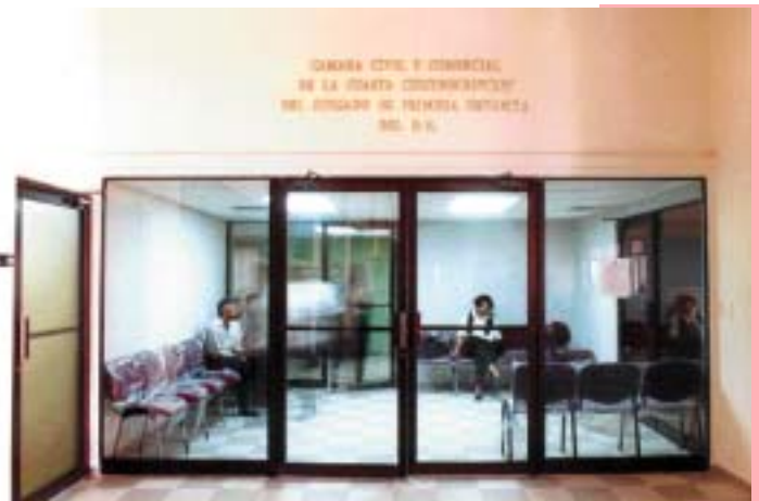
CÁMARA CIVIL Y COMERCIAL DE LA CUARTA CIRCUNSCRIPCIÓN DEL JUZGADO DE PRIMERA INSTANCIA DEL DISTRITO NACIONAL