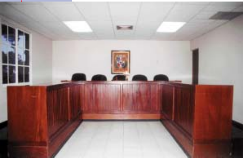
SALA DE AUDIENCIAS DE LA CORTE