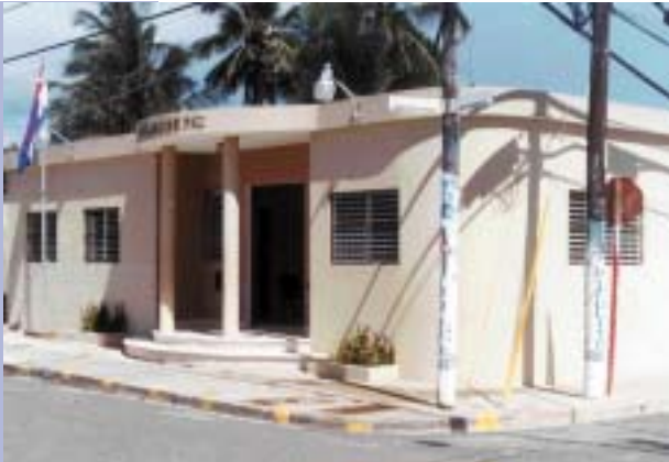
JUZGADO DE PAZ DEL MUNICIPIO DE