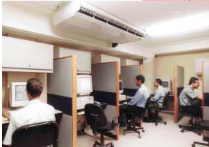
DEPARTAMENTO DE INFORMÁTICA DE LA SUPREMA CORTE DE