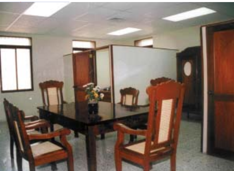
SALA DE DELIBERACIÓN DE LA CÁMARA PENAL DE LA CORTE DE APELACIÓN DEL DEPARTAMENTO JUDICIAL DE SAN CRISTÓBAL