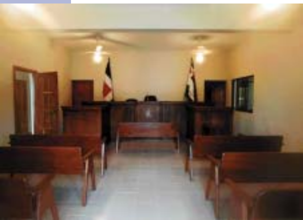
Suprema Corte de