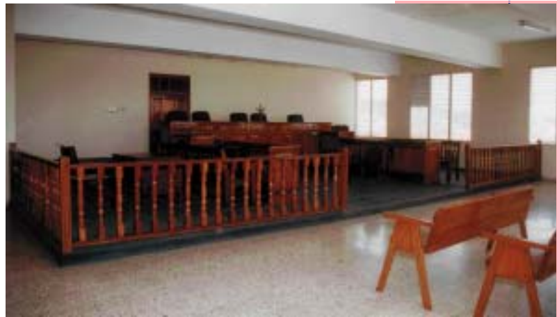
CÁMARA PENAL DE LA CORTE DE APELACIÓN DEL DEPARTAMENTO JUDICIAL DE SAN CRISTÓBAL