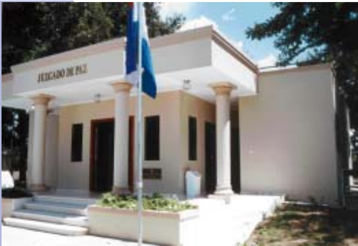
JUZGADO DE PAZ DEL MUNICIPIO DE LAGUNA