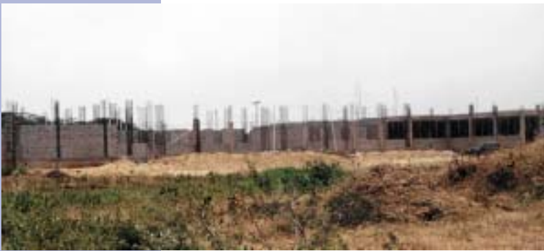
Suprema Corte de