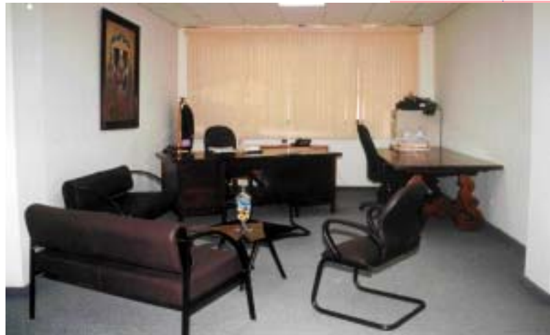
DESPACHO DE LA PRESIDENCIA DEL TRIBUNAL SUPERIOR DE