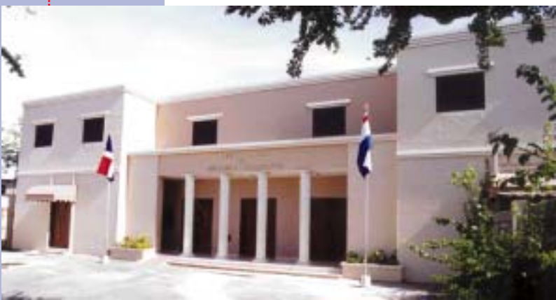
Suprema Corte de

CORTE DE APELACIÓN DE NIÑOS, NIÑAS Y ADOLESCENTES DE SANTO DOMINGO