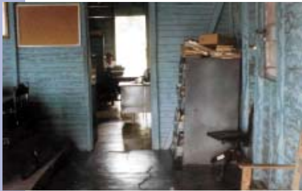
Suprema Corte de