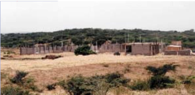
PALACIO DE JUSTICIA DE VALVERDE