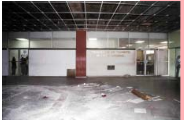
AMPLIACIÓN DEL TRIBUNAL DE TRÁNSITO DEL DISTRITO NACIONAL