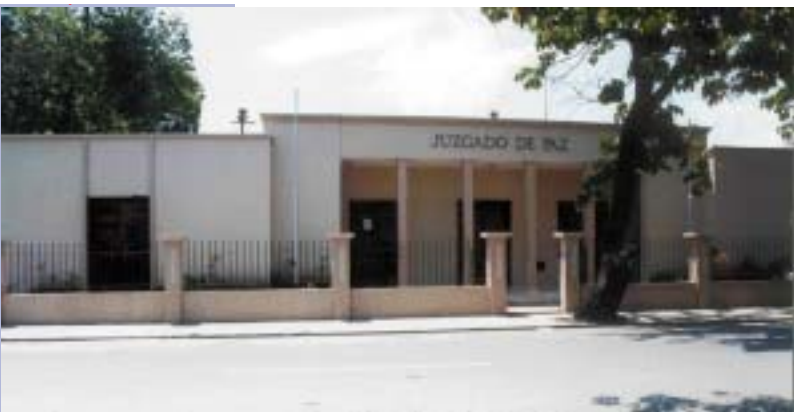
JUZGADO DE PAZ DE LA PRIMERA CIRCUNSCRIPCIÓN DEL MUNICIPIO DE LA