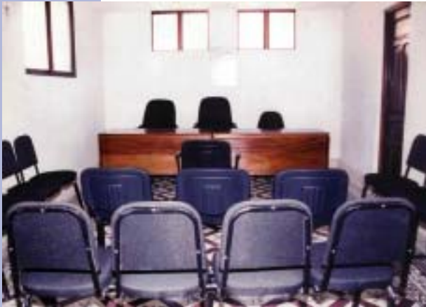
Sala de Audiencias del Tribunal de Niños,