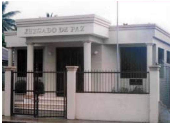
JUZGADO DE PAZ DEL MUNICIPIO DE ARENOSO