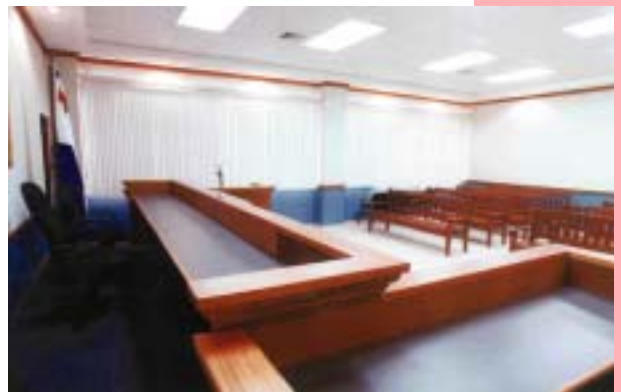
CÁMARA CIVIL Y COMERCIAL DE LA SEGUNDA CIRCUNSCRIPCIÓN DEL JUZGADO DE PRIMERA INSTANCIA DEL DISTRITO NACIONAL