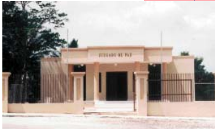
JUZGADO DE PAZ DEL MUNICIPIO DE RAMÓN SANTANA