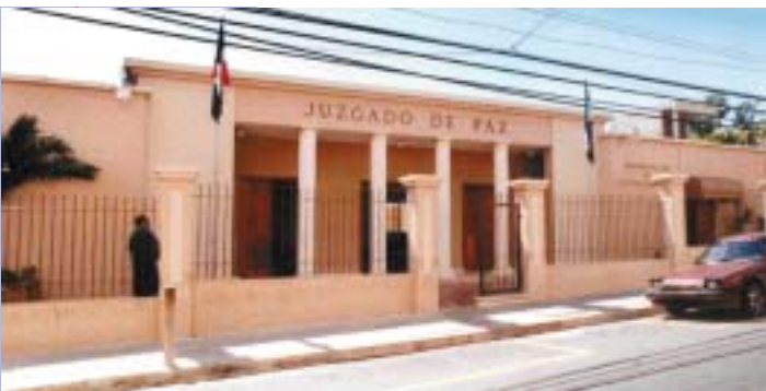
JUZGADO DE PAZ DE LA SEGUNDA CIRCUNSCRIPCIÓN Y JUZGADO DE PAZ