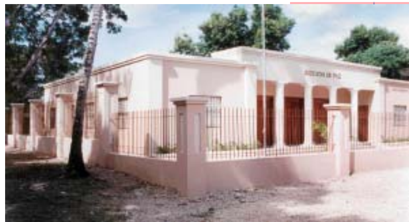
JUZGADO DE PAZ DEL MUNICIPIO