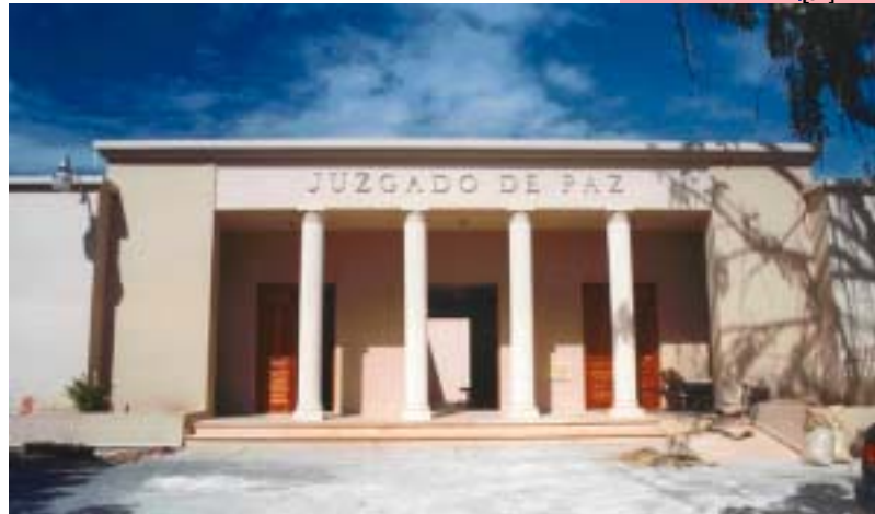
JUZGADO DE PAZ DE LA PRIMERA CIRCUNSCRIPCIÓN DEL DISTRITO NACIONAL