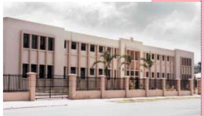
PALACIO DE JUSTICIA DE ESPALLAT