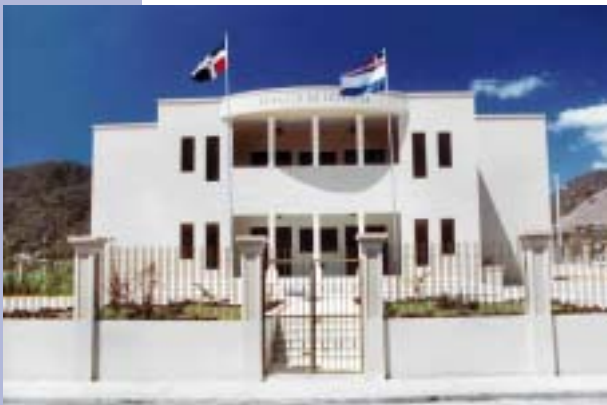
Suprema Corte de