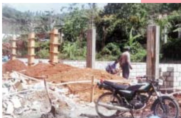
PALACIO DE JUSTICIA DE SAMANÁ