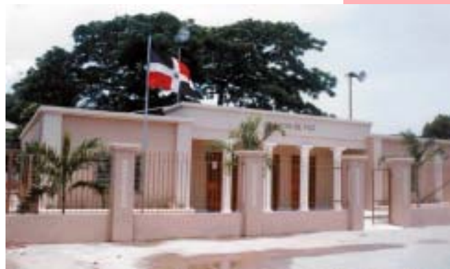
JUZGADO DE PAZ DEL MUNICIPIO DE VILLA BISONÓ