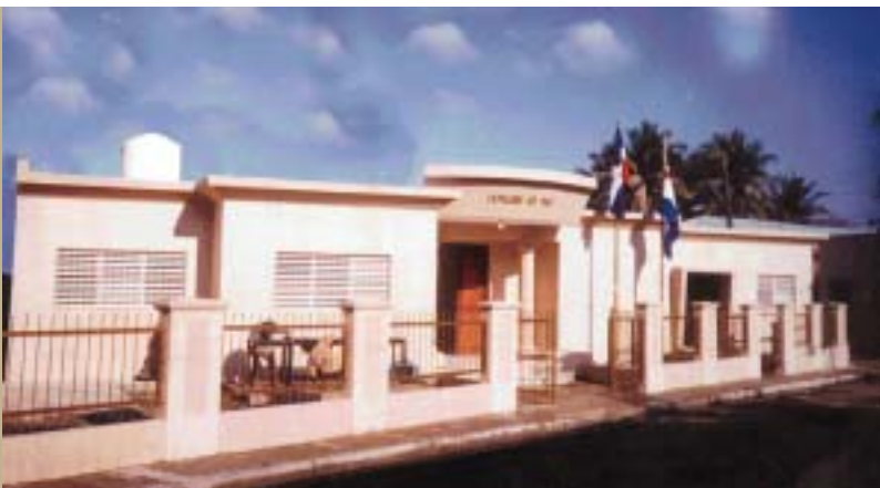
JUZGADO DE PAZ DEL MUNICIPIO DE LUPERÓN