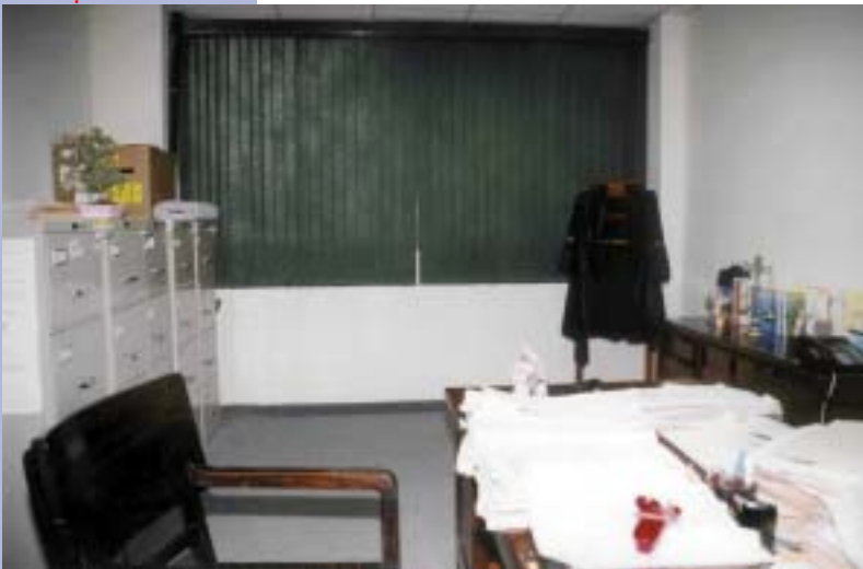
DESPACHO DE UN MAGISTRADO DEL TRIBUNAL SUPERIOR DE