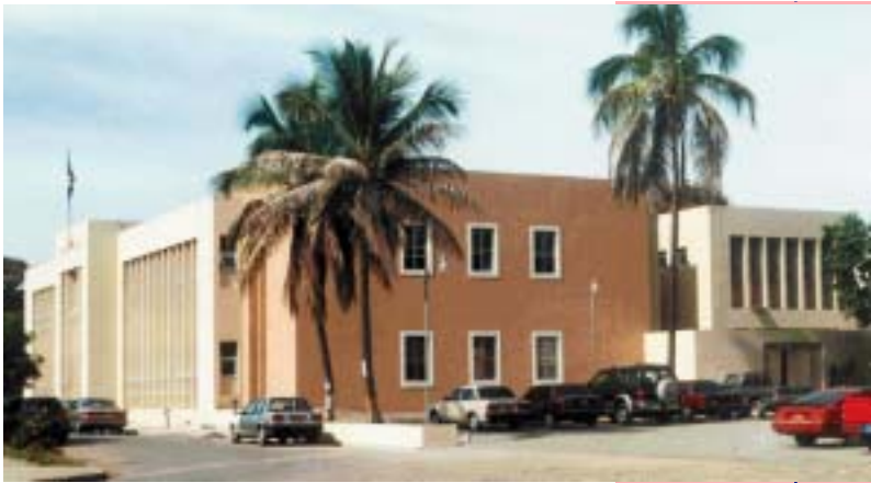
PALACIO DE JUSTICIA DE SAN JUAN DE LA MAGUANA