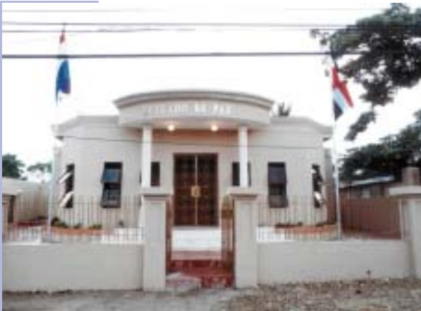
JUZGADO DE PAZ DEL MUNICIPIO DE