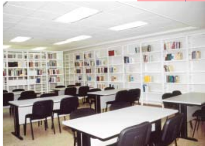
BIBLIOTECA DEL PALACIO DE JUSTICIA DE SANTIAGO