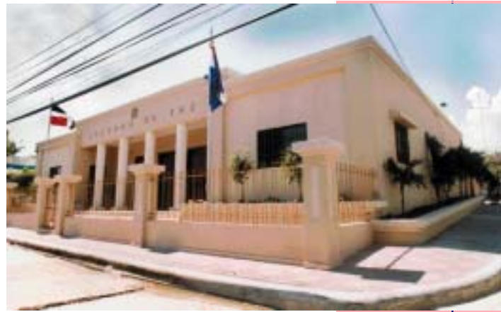
JUZGADO DE PAZ DEL MUNICIPIO DE