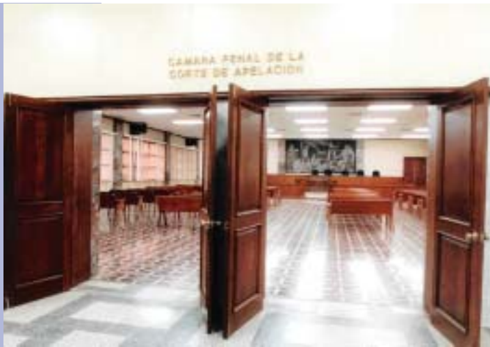
CÁMARA PENAL DE LA CORTE DE APELACIÓN DE SANTO