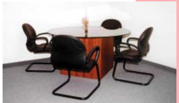
Huellas de la Reforma