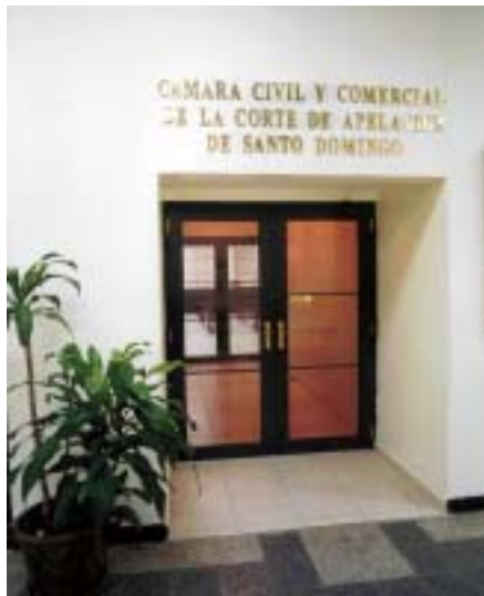
CÁMARA CIVIL Y COMERCIAL DE LA CORTE