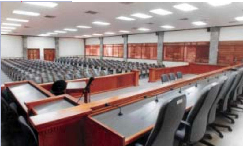
SALA DE AUDIENCIAS DE LA SUPREMA CORTE DE JUSTICIA