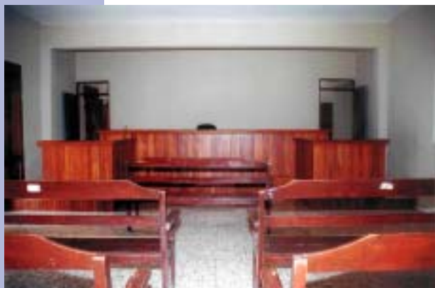
Suprema Corte de