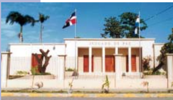
JUZGADO DE PAZ DE LA CUARTA CIRCUNSCRIPCIÓN DEL DISTRITO NACIONAL