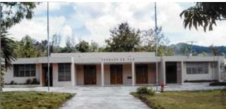
JUZGADO DE PAZ DEL MUNICIPIO DE CAMBITA