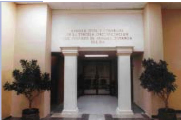
CÁMARA CIVIL Y COMERCIAL DE LA TERCERA CIRCUNSCRIPCIÓN DEL JUZGADO DE PRIMERA INSTANCIA DEL DISTRITO NACIONAL