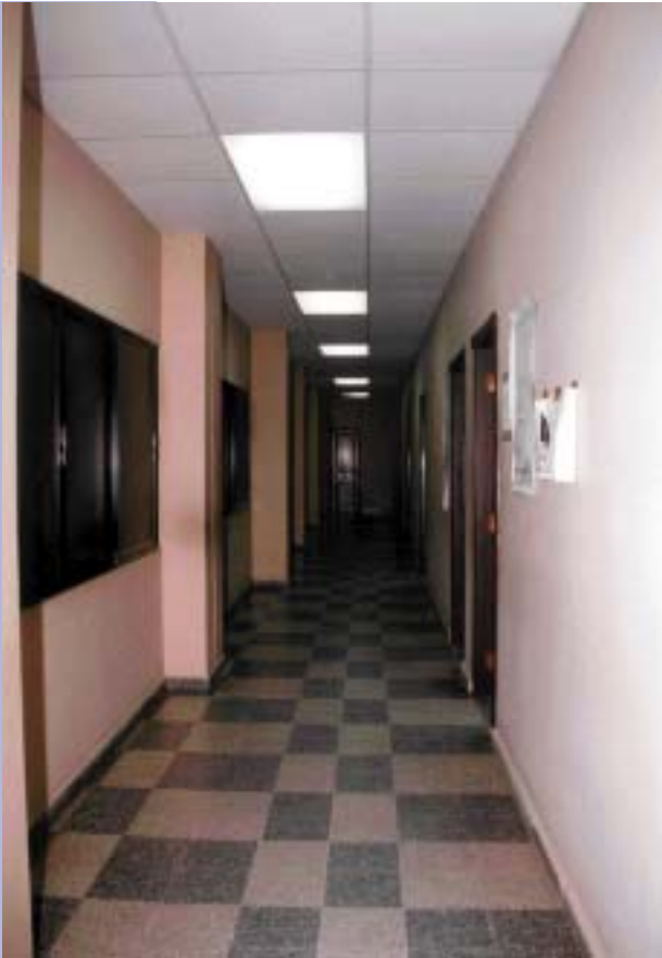
ÁREA DE DESPACHOS DE LOS JUECES