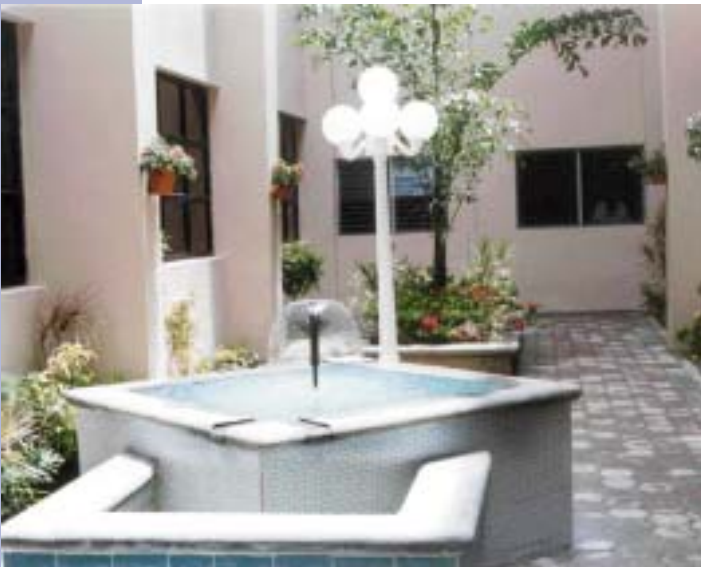
PLACITA DE TEMIS EN LA SUPREMA CORTE DE JUSTICIA