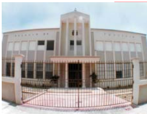
PALACIO DE JUSTICIA DE INDEPENDENCIA