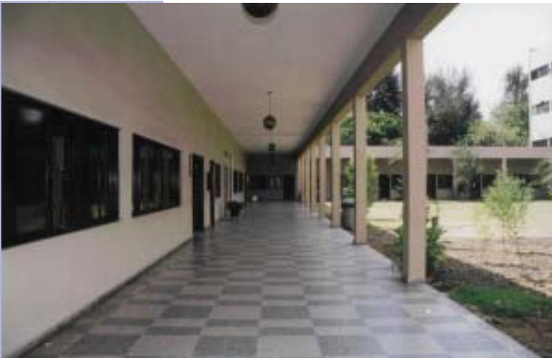
ÁREAS ACONDICIONADAS DEL TRIBUNAL SUPERIOR DE TIERRAS