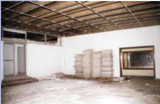
Suprema Corte de