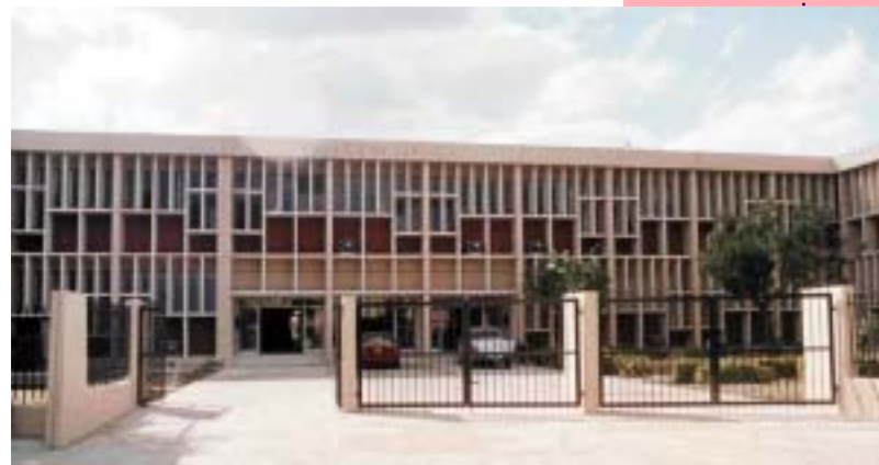
PALACIO DE JUSTICIA DE SAN PEDRO DE MACORÍS