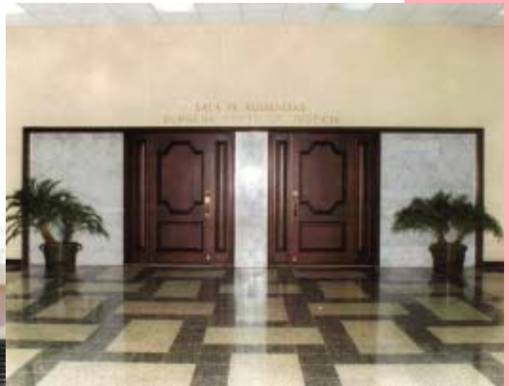
SALA DE AUDIENCIAS DE LA SUPREMA CORTE DE