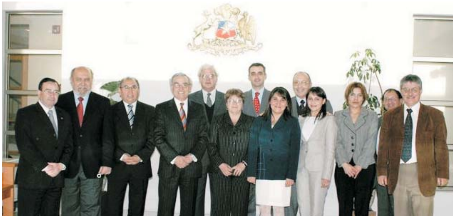
Ministro Milton Juica, al centro, con jueces de la Jurisdicción de Coyhaique.

Jornadas de intenso trabajo tuvieron los jueces y ministros de la Corte de Apelaciones de Coyhaique durante los últimos días de noviembre ya que, además de sus labores habituales, se capacitaron en materia comunicacional y recibieron la visita del Ministro de la Corte Suprema Milton Juica.