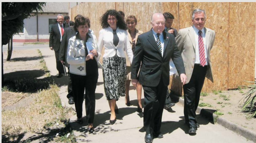
El Ministro Tapia en su visita a las obras del Juzgado de Letras y Garantía de Yumbel.

A poco más de un mes de dejar su cargo, el Presidente de la Corte Suprema, Ministro Enrique Tapia Witting, realizó una visita de tres días a la jurisdicción de Concepción. Durante su permanencia en la capital de