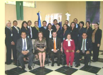
Grupo de fiscales capacitados en Técnicas de Litigación