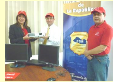
Escuela recibe donación de la empresa Claro

Todo lo anterior implica una serie de esfuerzos institucionales y externos, pero se aprovecha este espacio para reconocer el trabajo del equipo de la ECF, especialmente los (las) facilitadores (as) externos a la Escuela de Capacitación Fiscal de las áreas Jurídicas, Administrativas y Psico-social de la Institución quienes, además de cumplir con sus labores diarias, preparan material y capacitan a sus compañeros (as), utilizando sus talentos y conocimientos en beneficio de la Institución.