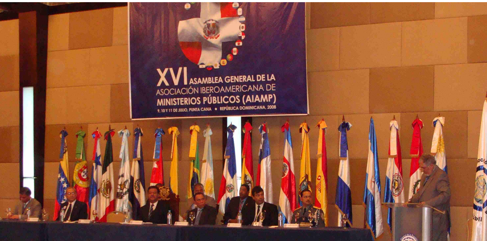
Inauguración de la XVI Asamblea de la AIAMP en Punta Cana