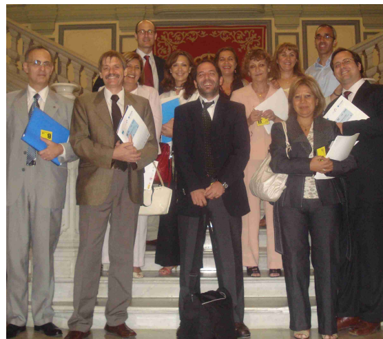
Delegación argentina en el Ministerio de Justicia de España

Este intercambio persigue mejorar los sistemas de cumplimiento y aplicación de los diferentes acuerdos internacionales y legislaciones nacionales referentes a la protección jurídica del niño y del joven a través de una transferencia de experiencias desde España y Francia hacia los sistemas legal, administrativo y judicial de las provincias argentinas de Córdoba, Entre Ríos, La Rioja, Santa Cruz y Salta.