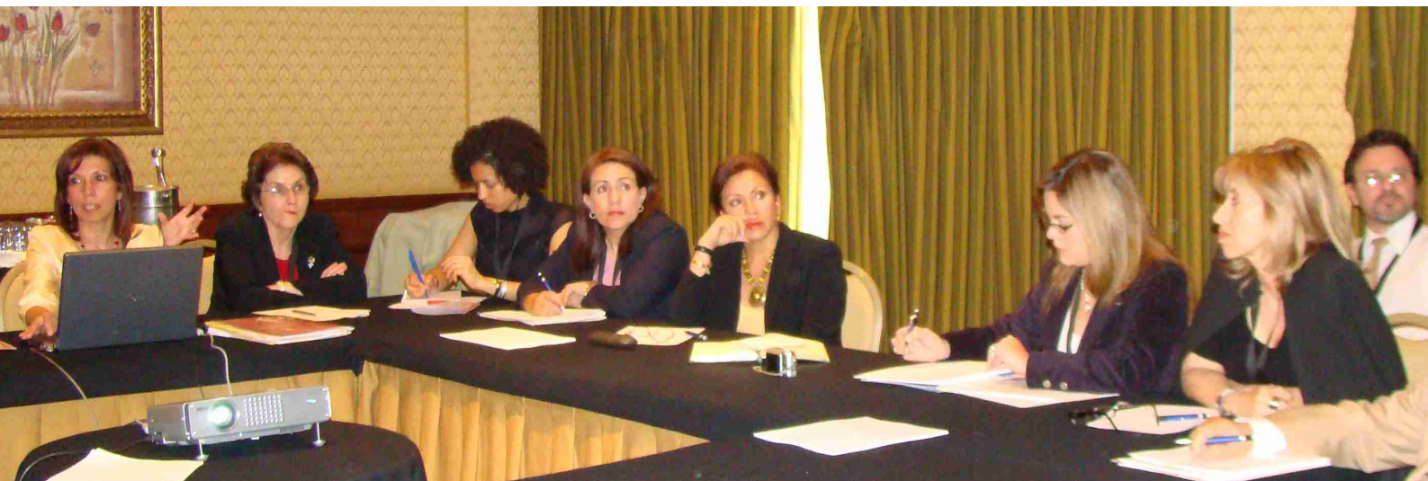
Taller intersectorial con miembros de los sectores Justicia, Educación y Salud del Programa EUROsocial

Los días 23 a 25 de junio de 2008 se celebró en México DF, con la asistencia de un total de 305 participantes, el III Encuentro Internacional de Redes EUROsocial, que anualmente reúne a los cinco sectores del Programa EUROsocial, y que en esta ocasión tuvo como objetivo avanzar en la conceptualización y la definición de actividades concretas en temas inter-sectoriales prioritarios para la promoción de la cohesión social en América Latina.