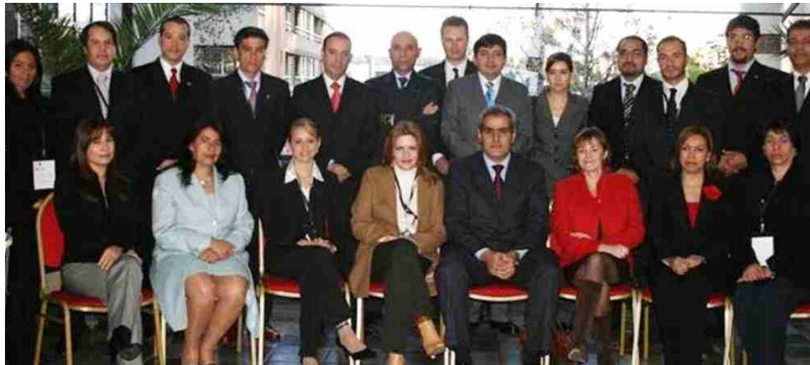
Comisiones de trabajo de Víctimas y Testigos que elaboraron las Guías de Santiago

roamericanos además de España y Portugal. La Asociación está Presidida en este momento por el Fiscal General del Estado de España, D. Cándido Conde-Pumpido Touron, y la Secretaría General reside en la Fiscalía Nacional de Chile, a la que pertenece su secretario permanen-