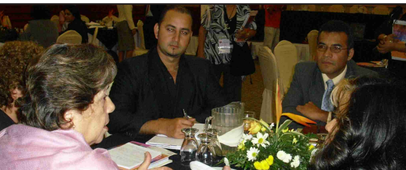
Participantes trabajando por grupos en el taller de Guatemala

Esta actividad integra a distintas Instituciones del Sector Justicia de Guatemala, Honduras, Nicaragua, El Salvador y Brasil, y su fin es conocer la experiencia de España y Francia en la Asesoría Jurídica Gratuita a las Víctimas de Violencia de Género. Tras la pasantía en España y Francia en diciembre de 2007, se realizaron Talleres de trabajo en Guatemala, Honduras y Nicaragua con el fin de multiplicar los conocimientos adquiridos y fijar objetivos concretos en este campo. Cada taller contó con 50-60 participantes de instituciones y sociedad civil además de ponentes locales e internacionales de España, Brasil y El Salvador.