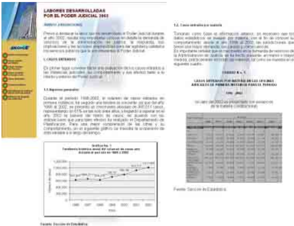
Gráfico 2. Sitio Web de Información del Sistema Judicial de Costa Rica

En los últimos años, probablemente como consecuencia de la firma del Convenio sobre Sistema de Información, pero sobre todo por el concurso de la sociedad civil, se ha hecho pública la información estadística sobre el desempeño del Poder Judicial de Argentina, también a través de instrumentos cibernéticos de difusión. En el Portal de la Justicia Argentina ( http://www.justiciaargentina.gov.ar/index.htm ) es posible encontrar estadísticas judiciales de los años 1996 y 2000 (véase Gráfico 3). De igual forma, se puede acceder desde allí al informe sobre el sistema judicial de Argentina, elaborado por Martín Gershanick y otros investigadores para el Ministerio de Justicia y Derechos Humanos en el marco del Programa de Apoyo a la Reforma del Sistema de Justicia (BID).