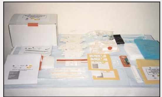
Los kits fueron cedidos por el Instituto de la Mujer de España a través del Centro de Estudios Jurídicos.

La primera actividad consistió en una asistencia técnica y en el envío de 250 kits para mejorar el proceso de recogida de muestras en caso de agresión sexual, que están siendo distribuidos a través del Ministerio Fiscal y de la Secretaría de la Mujer por todo el territorio nacional.