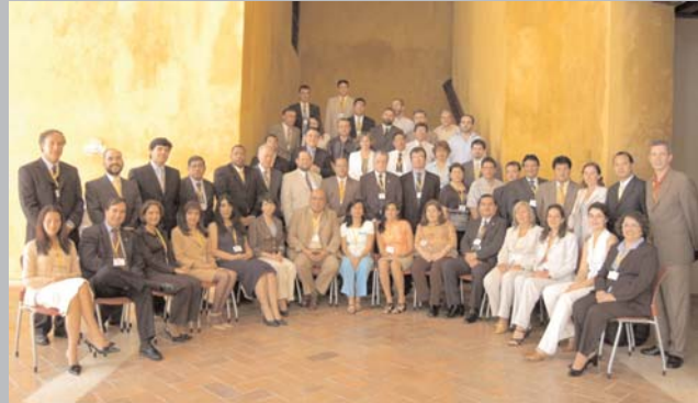
Asistentes al Encuentro de Redes de EUROsociAL Justicia

En el marco del encuentro, el sector Justicia reunió a sus redes particulares que representaban a 47 instituciones latinoamericanas y europeas. En el transcurso de la reunión, cuatro participantes de los intercambios de experiencias llevados a cabo en el primer semestre de 2006 presentaron sus experiencias y conclusiones.