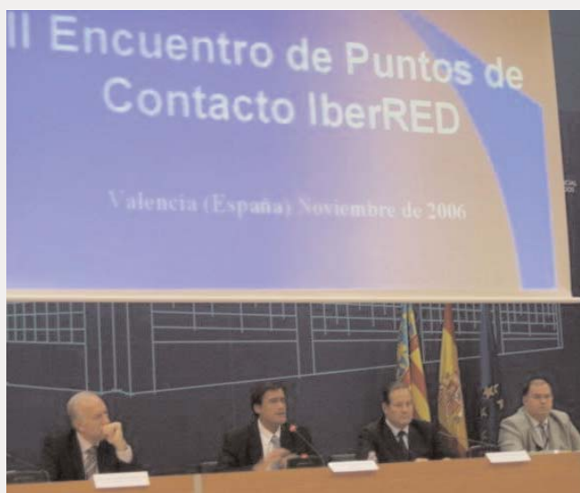
Autoridades presentes en el encuentro.

de investigaciones y operativos policiales de distintos países iberoamericanos y europeos. Como resultado del encuentro, se aprobaron los "Principios de Viabilización de Cooperación Judicial Civil" y el "Protocolo de Actuación y Funcionamiento de los Puntos de Contacto en materia penal" que se convierten en instrumentos al servicio de la red.