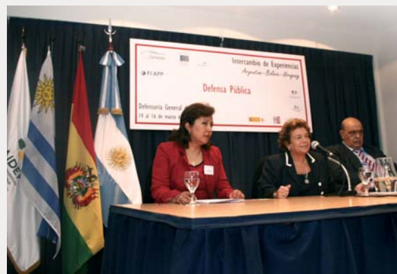
En el centro de la imagen la Defensora General de Argentina, Stella Maris Martínez, junto a sus homólogos de Uruguay y Bolivia.

Las jornadas se complementaron con visitas a distintas dependencias del Ministerio Público de la Defensa de Argentina, a establecimientos carcelarios y de internación e institutos neuropsiquiátricos.