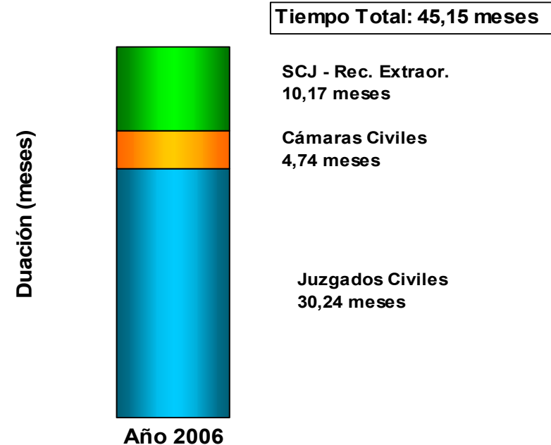
DURACION DEL PROCESO CIVIL Año 2006