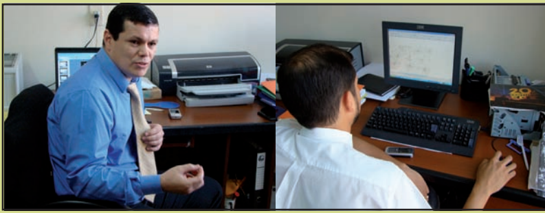
Expertos en pericia informática del Ministerio Público