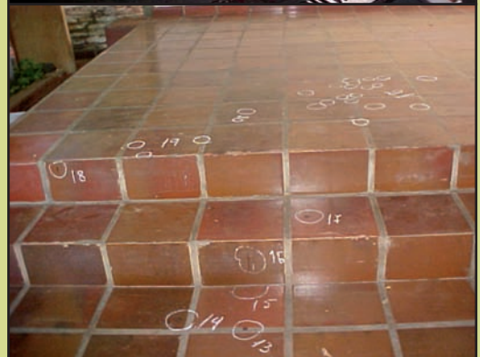
Fotografías captadas por los investigadores el día del homicidio, el 25 de enero del año 2003. En las imágenes se observan los rastros de sangre en varias partes de la casa, el arma homicida, y los destrozos causados en la sala de grabaciones donde víctima y victimario se encontraban.