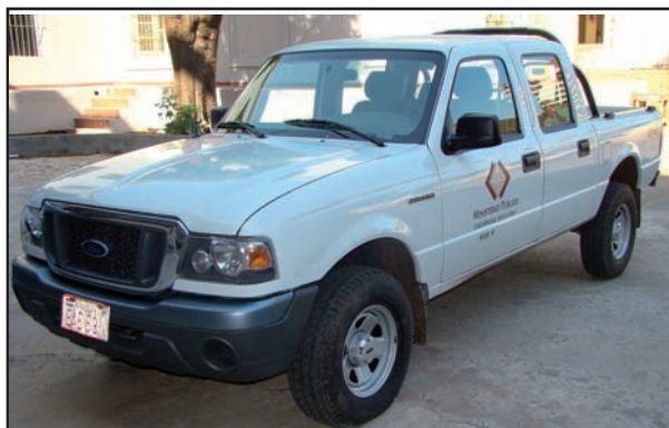
Camioneta adquirida para el servicio de la Oficina de Asuntos Étnicos.

A finales de noviembre del año pasado, la Fiscalía General del Estado, a través de la Resolución N° 4116, asignó a la Oficina de Asuntos Étnicos un vehículo Ford Ranger “0” adquirido a través de licitación pública nacional. La naturaleza de las funciones propias del Ministerio Público, traslados, constituciones, hace imprescindible la asignación de un vehículo por la institución en carácter permanente, con el objeto de optimizar el servicio a cabalidad y la gestión necesaria en función a las causas establecidas. Para la asignación del móvil se tuvo en cuenta las actividades desarrolladas en dicha oficina, de modo a brindar a la sociedad una respuesta eficiente y efectiva en el fiel cumplimiento de las tareas asignadas y que se encuentran acorde a requerimientos exigidos en la Ley. Es recomendable que los funcionarios de Asuntos Étnicos cuenten con los recursos necesarios para actuar inmediatamente al tener conocimiento de algún hecho que involucre a un indígena y asistirlo en el proceso.