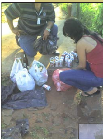
Funcionarios de la fiscalía decomisando bebidas.

Cabe resaltar que, para evitar la polución ambiental y ante las constantes quejas de los pobladores, los efectivos policiales obligaron a los conductores a que disminuyeran el volumen de las músicas de sus rodados. Con estos controles, el Ministerio Público demuestra su compromiso con la ciudadanía, demorando y aplicando multas a los infractores. Las tareas conjuntas con la Policía, en las ciudades que acogen a los veraneantes, hasta el 15 de febrero, fecha de clausura de la temporada veraniega en San Bernardino y en otras localidades del departamento de Cordillera.