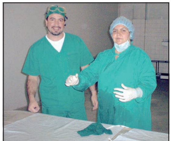
Funcionarios de la Dirección de Medicina Legal.

"Todo objeto o sujeto que entre en contacto con el perpetrador de un crimen puede llevar en sí evidencias que puedan ser relacionadas con el autor de los hechos investigados. Así es que solo a manera de ilustración mencionaremos: gafas, sombreros, cinto, ropa, goma de mascar, envases de bebidas, teléfono, cigarrillos y otros"