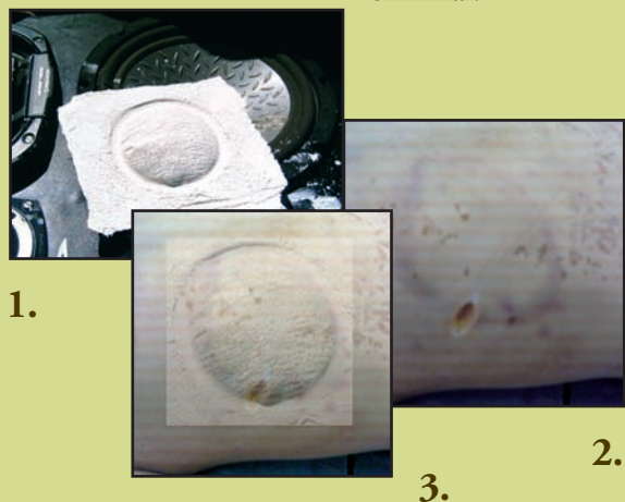
(1) Extracción de muestras del vehículo Ford Escort propiedad de Julio C. Samudio, el 5 de abril del año 2005. (2) Imagen de la lesión sufrida por Amín Riquelme (3) Superposición de imágenes. La muestra del vehículo más la imagen de la lesión

De esta forma se pudo probar la implicancia de Julio César Samudio en el hecho. Según el cuaderno de investigación, éste prestó su auto, que fue utilizado para ejecutar el plan y custodió a la víctima. Amín murió en su vehículo. Samudio fue condenado a 25 años, más 5 años como medida de seguridad por secuestro, homicidio doloso y asociación criminal.