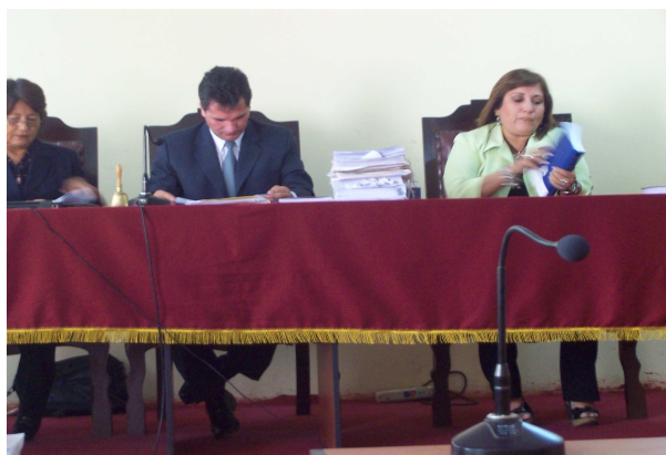
Magistrados del Colegio de Tacna leyendo el expediente antes de empezar el juzgamiento.

3) TIEMPO DE DURACIÓN DE LAS AUDIENCIAS: En los distritos judiciales visitados no existe aún un sistema de medición del tiempo de duración de la audiencia. Las audiencias empiezan a la hora señalada (en la mayoría de casos), sin embargo en muchos casos duran demasiado, así una audiencia de prisión preventiva en el distrito judicial de Tacna duró 4 horas. Se ha podido observar también que los jueces en su mayoría, salvo en algunos distritos judiciales como en Trujillo, no resuelven en la misma sala de audiencias, sino que se retiran a su Despacho por un espacio de una o más horas a “elaborar” la resolución que luego es leída en el proceso. Como la audiencia se registra en audio, al momento del receso se hace una pausa, por lo que el mismo no revela el tiempo real que demora la audiencia.