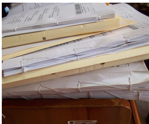
Expedientes Cocidos en Ilo (distrito judicial de Moquegua)-Riesgo de la Oralidad en el NCPP.

En efecto, los artículos 120°, 136° y 361° del NCPP regulan el registro de la audiencia en acta y el contenido del expediente. Aunque el artículo 361° establece que el acta contendrá una síntesis de lo actuado en la audiencia, sin embargo los jueces de investigación preparatoria, unipersonales y asistentes judiciales con los que me entreviste manifestaron su preocupación porque los miembros del colegiado y la Sala de Apelaciones los “obligan a transcribir todo el audio”, a sacar copias certificadas de la carpeta fiscal y “cocer expedientes” . Esto especialmente en los distritos de Tacna y Moquegua (en Ilo provincia de Moquegua encontré expedientes cocidos). Esta mala práctica de los operadores judiciales en el registro de audiencias, sin duda constituye un grave riesgo para la oralidad en el proceso penal.