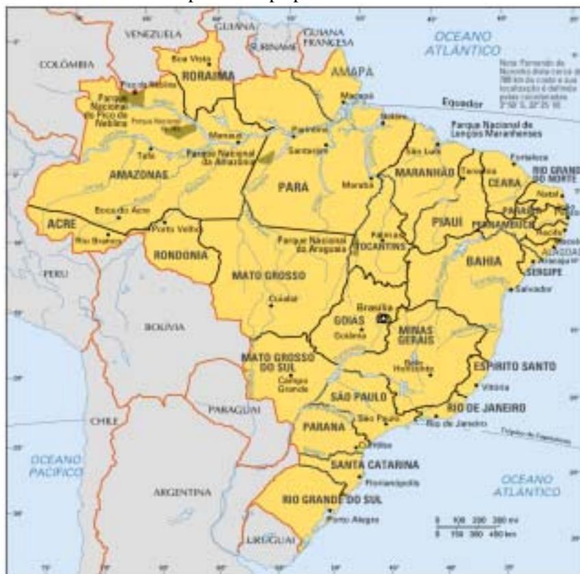
Mapa 1 – Mapa político do Brasil