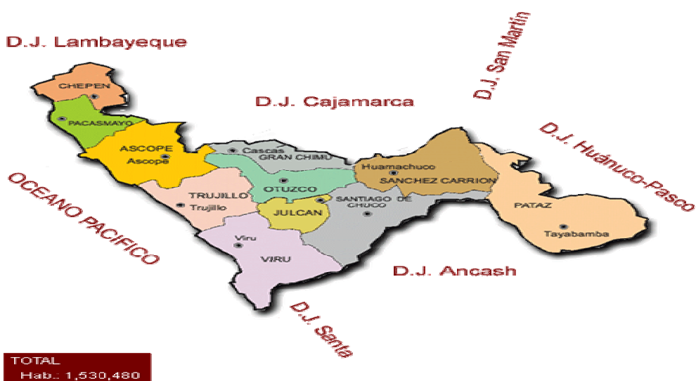
FIGURA Nº 1