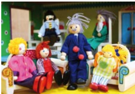
Los juegos y las representaciones forman parte de las terapias que ayudan a los niños a resignificar sus experiencias.

Eugenio San Martín, director del Sename, informó que "en los últimos 5 años el aumento de cobertura ha sido de un 41%, la que esperamos seguir reforzando". El año 2003 había 2 mil 169 plazas de cobertura y 26 proyectos.