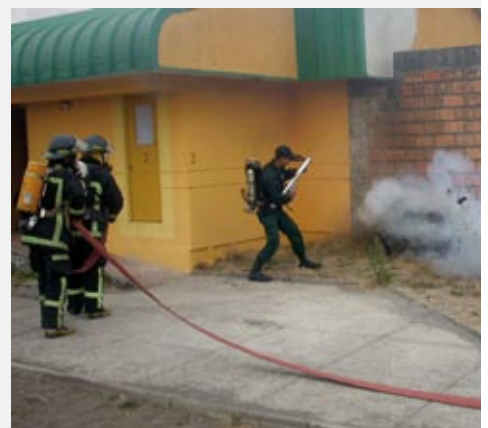
En el centro Coronel se realizó un simulacro de incendio, que incluyó el ensayo de los planes de contingencia.

Junto con esto, el Sename y el Cuerpo de Bomberos están realizando simulacros de incendio en los centros del país. Coronel, Punta Arenas, Rancagua, entre otros, ya se han sumado a esta importante experiencia.