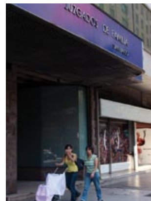
95 nuevos jueces y cerca de 600 funcionarios incluye el proyecto de ley que busca reforzar la nueva justicia de familia.

El proyecto de ley incrementa en casi un 70% los recursos originales destinados al funcionamiento de la Nueva Justicia de Familia, pasando de los $ 29 mil millones actuales a $ 49 mil millones. En cuanto a dotación de jueces, el aumento llega a un 36% respecto de la situación actual, mientras que la cantidad de funcionarios administrativos crece en un 60%, pasando de 1.067 a 1.707 personas.