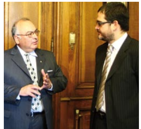
El presidente nacional del Cuerpo de Bomberos de Chile, Miguel Reyes, junto al director del Sename, Eugenio San Martín.

San Martín agregó que “estas medidas se suman a otras acciones que contempla el plan especial de fortalecimiento de centros de responsabilidad penal adolescente”.