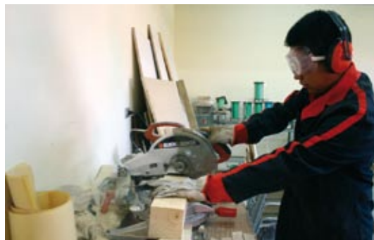
El enfoque psicoeducativo se aplica hace 20 años en Québec. Tres de cada cuatro adolescentes que asisten a estos programas, no vuelven a cometer delitos.

Según el experto, un punto esencial para conseguir la reinserción social de los adolescentes es formar educadores de primera línea, preparados y motivados para trabajar con jóvenes que han cometido delitos. "Los muchachos necesitan de interventores con buena formación y dispuestos a vivir en lo cotidiano con ellos".