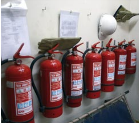
Chaquetas antifiama, estanques de oxígeno y extintores son algunos de los elementos de seguridad de los centros.

• Teléfonos rojos para comunicación directa con Bomberos, capacitación especializada a brigadas de emergencia y nuevos expertos en seguridad; reforzamiento de todos los planes de intervención temprana y la creación de una Mesa Técnica de Seguridad donde participa Gendarmería, son algunas de las medidas que incluye esta iniciativa.