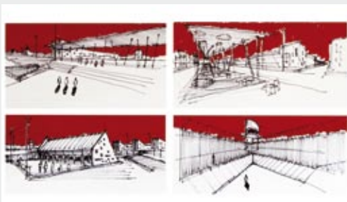
Croquis proyectivo para los futuros centros cerrados.

Una de las prioridades del Gobierno es contar con nuevos centros cerrados, que permitan una intervención socioeducativa de mayor calidad y mejores condiciones para adolescentes y funcionarios.